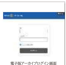
電子版アーカイブログイン画面

ご注意！！ 電子版・アーカイブの閲覧には、クラブごとのIDとパスワードが必要です。パスワードは半期に一度(7月15日と1月15日)に変更します。ご所属のロータリークラブ事務局まで、お問い合わせください。