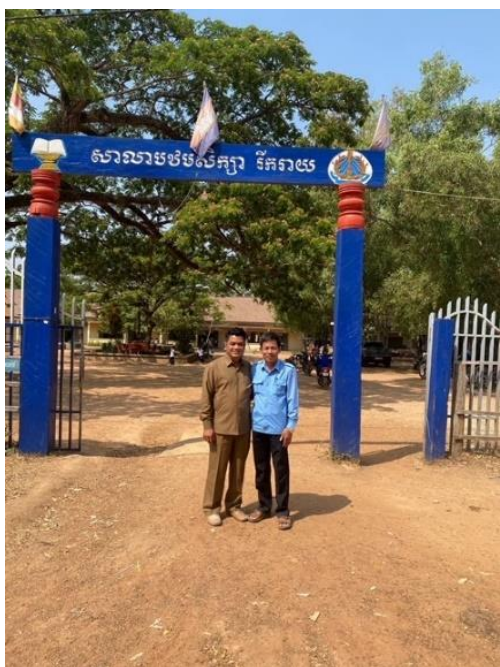
ビラクさん(左)と校長先生(右)