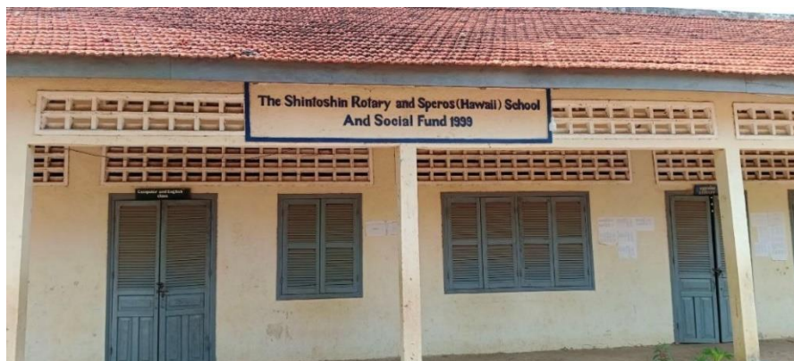
The Shintoshin Rotaly and Speros(Hawaii) School And Social Fund 1999 の表示