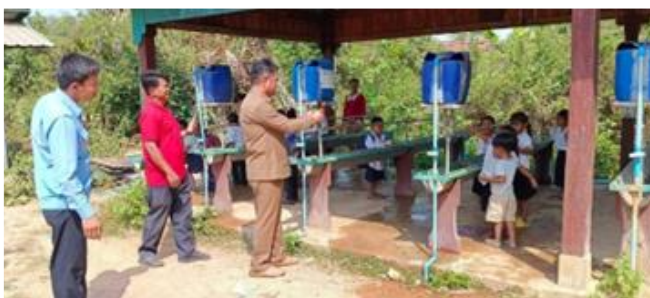
ビラクさんと校長先生と副校長先生（赤い服）