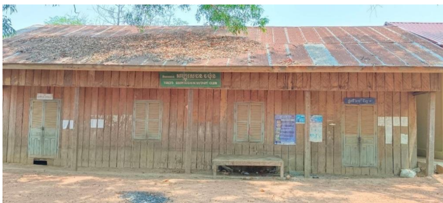
TOKYO SHINTOSHIN ROTALY CLUB の表示